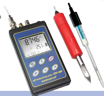
wählen Sie das Gerät mit der passenden Elektrode: CPC-401M für Fleisch oder Wurst (mit Edelstahlklinge) CPC-401W für Käse (Glaselektrode)