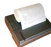
Drucker PCE-BP1 als Zubehör erhältlich