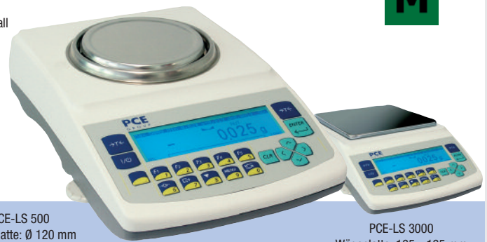
PCE-LS 500 Wägeplatte: Ø 120 mm