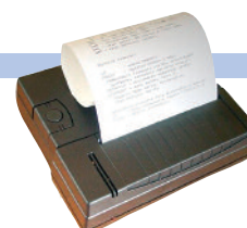
Drucker PCE-BP1 als Zubehör erhältlich